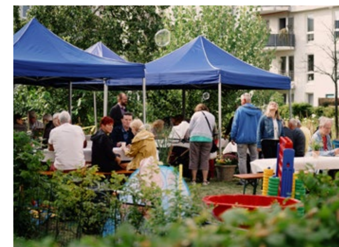
Kaffee macht Laune: Mehr als 50 Gäste trafen sich zum Plausch.

Um das kulinarische Angebot kümmerte sich die Genossenschaft! Unsere Mieter und Mieterinnen sowie deren Haushaltsangehörige ließen sich mit leckerem Kuchen, Herzhaftem vom Grill und Getränken verwöhnen – natürlich kostenlos.