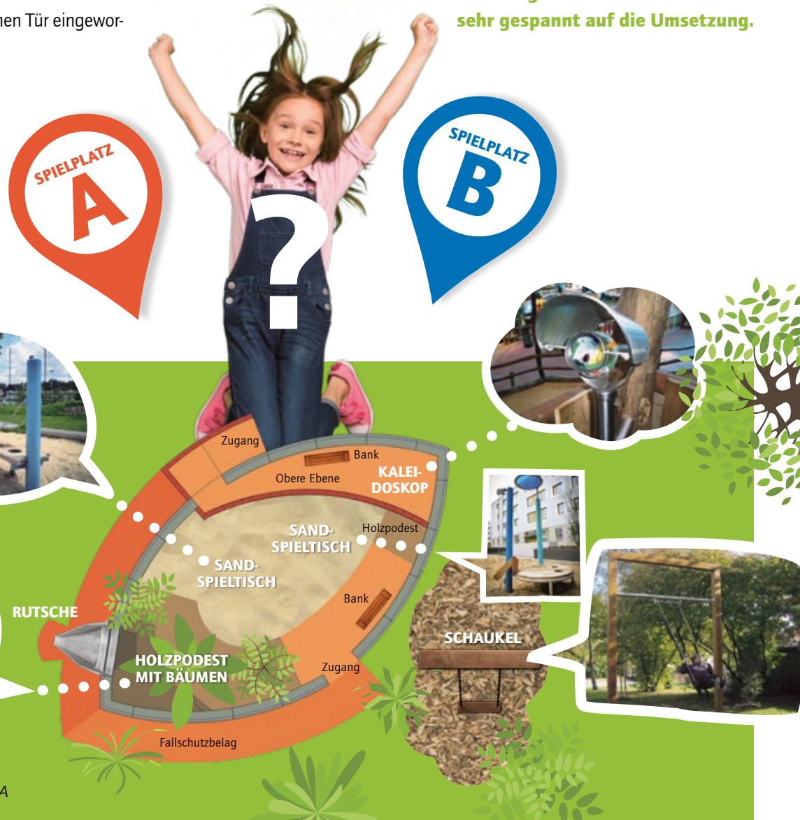
Klarer Sieger: Planungsvariante A

Wir freuen uns über die rege Beteiligung! Nun kann der Umbau beginnen und wir sind schon sehr gespannt auf die Umsetzung.